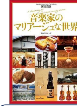
音楽家のマリアージュな世界 伊熊 よし子／監修 音楽之友社