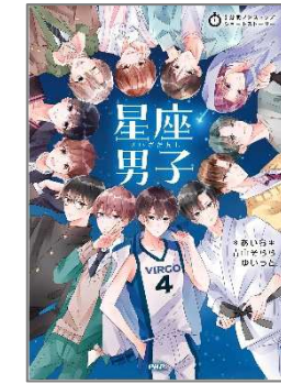
星座男子 *あいら*／著 PHP 研究所