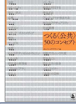
つくるく公共の50のコンセプト せんたいメディアテーク／編 岩波書店