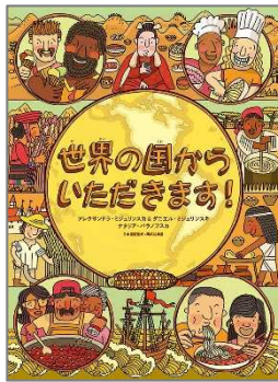
世界の国からいただきます！ アレクサンドラ・ジェリンスカ／文 徳間書店