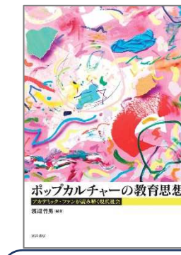
ポップカルチャーの教育思想 渡辺 哲男／編著 晃洋書房