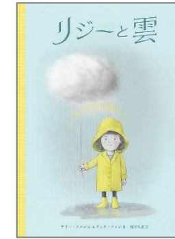
リジーと雲 テリー・ファン／作 化学同人