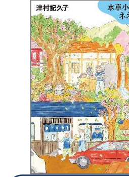
水車小屋のネネ 津村 記久子／著 毎日新聞出版