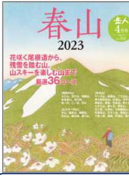
春山 株式会社ネイチャーエンタープライズ