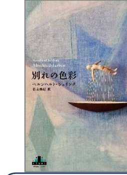
別れの色彩 ベルンハルト・シュリンク／著 新潮社