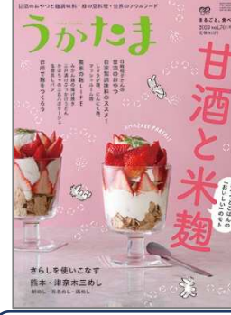
うかたま 農山漁村文化協会