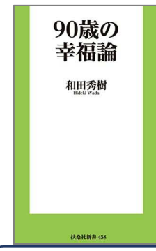
90歳の幸福論 和田 秀樹／著 扶桑社