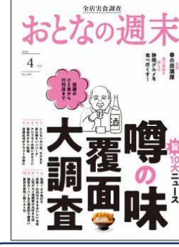
おとなの週末 講談社

2月の利用状況 開館日数：23日 利用者数：1,263人(54.9人/日) 貸出点数：4,461点(193.9点/日)