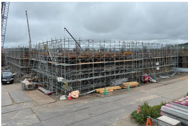
③令和8年5月27日 現場事務所2階から撮影