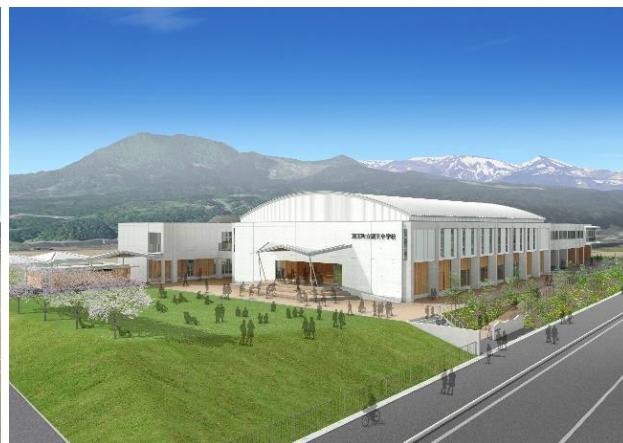
北東側からの体育館外観