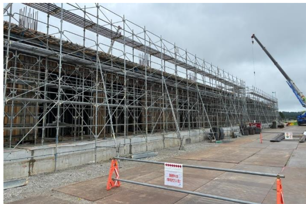
④令和8年5月27日 1階保健室前付近から撮影