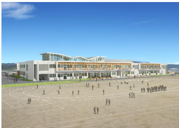
南側からの校舎外観