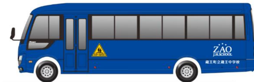
蔵王中学校で導入予定のスクールバス（イメージ）