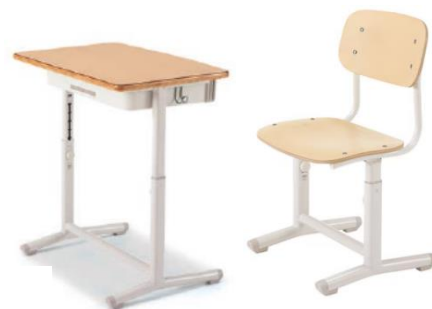
購入予定の生徒机・椅子