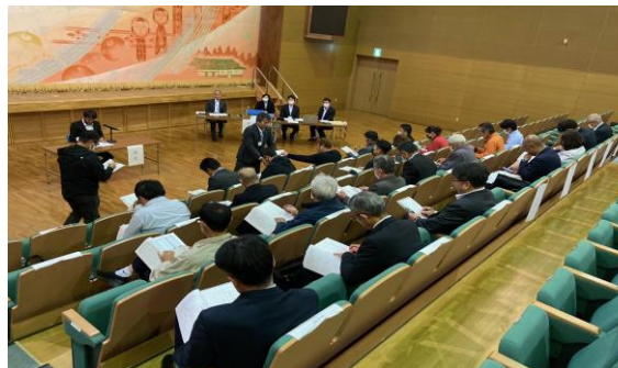
10月16日に開催された第7回統合準備委員会での投票の様子

なお選考の際、山形県にも同じ名前の中学校があるのではとの質問がありましたが、山形県では山形市立蔵王第一中学校と蔵王第二中学校という名称になっています。