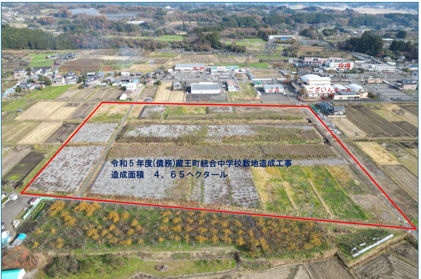
令和5年11月23日ドローンで撮影

この度、統合中学校敷地造成工事を一般競争入札により発注し、春山建設・村山建設特定建設工事共同企業体が落札しました。その後、工事請負仮契約を締結し、11月6日に開催された蔵王町議会定例会11月会議で工事請負契約締結の議案が可決されました。今後、工事は令和6年10月31日完成の予定で進められますが、現地では町建設課発注の町道拡幅工事も同時に施工しており、通行止め等の交通規制がなされておりますので、案内看板や交通誘導員の指示に従って通行されるようご協力をお願いいたします。