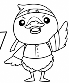
みやぎハローワークキャラクター 「ガンちよーさん」