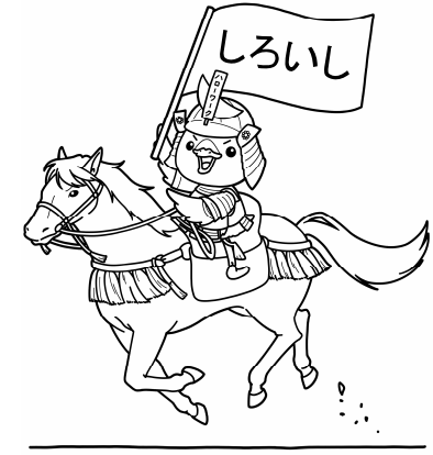
みやぎハローワークキャラクター 「ガンちょーさん」