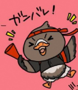
みやぎハローワークキャラクター 「カンちょーさん」