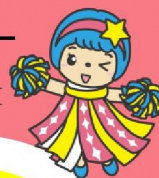
宮城県福祉人材センター マスコットキャラクター 「ふくしのほっぴい」