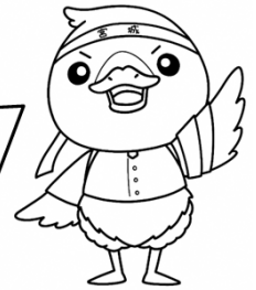
みやぎハローワークキャラクター 「ガンちよーさん」