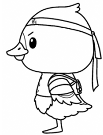
みやぎハローワークキャラクター 「ガンちょーさん」