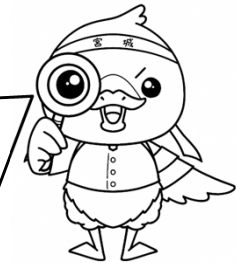
みやぎハローワークキャラクター 「ガンちよーさん」