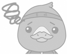
みやぎハローワークキャラクター ガンちょーさん